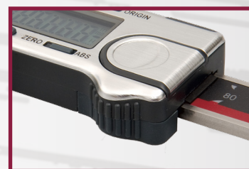
možnost objednání bez kolečka

Volitelné příslušenství Datový USB interface pro PC obj.č. 6040-05-900